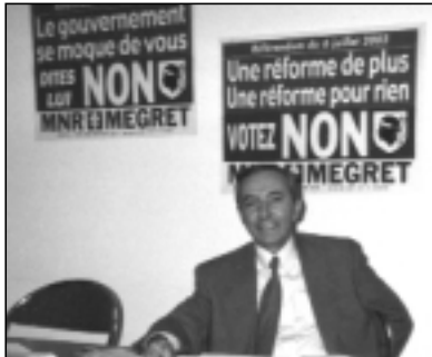
Conférence de presse de Bruno Mégret à Ajaccio quelques jours avant le référendum : le MNR est le seul parti politique au niveau national à avoir appelé à voter non.

Bruno Mégret, qui s'était rendu à Ajaccio pour faire campagne en faveur du non, se réjouit qu'une majorité de Corses n'aient pas voulu mêler leurs voix à celles des indépendantistes. Il constate que ce résultat est un formidable camouflet pour MM. Chirac, Raffarin et Sarkozy qui n'ont pas réussi à convaincre, malgré la mise en scène électoraliste de l'arrestation de M. Colonna.